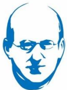
Priester Jesu Christi

Johannes 6: 66 Daraufhin zogen sich viele seiner Jünger zurück und gingen nicht mehr mit ihm umher. 67 Da fragte Jesus die Zwölf: Wollt auch ihr weggehen? 68 Simon Petrus antwortete ihm: Herr, zu wem sollen wir gehen? Du hast Worte des ewigen Lebens. 69 Wir sind zum Glauben gekommen und haben erkannt: Du bist der Heilige Gottes.